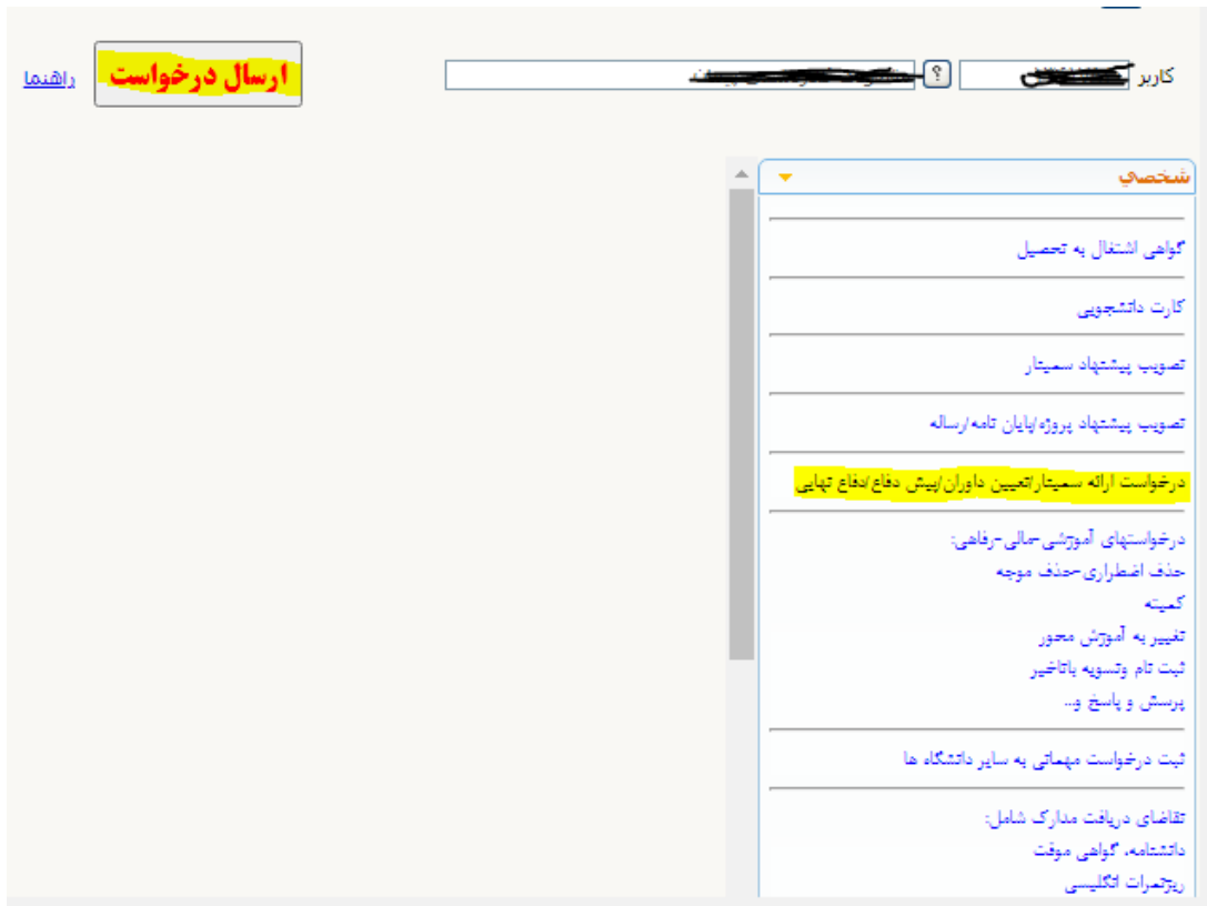
تصویر شماره ۳

۲- در مرحله بعدی، پس از ارسال درخواست، تصویر زیر نشان داده می شود.