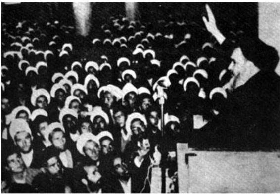
۱۵ خرداد ۱۳۴۲ سرآغاز انقلاب اسلامی ایران