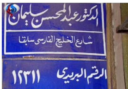
تغییر نشانی نام یک خیابان در مصر

بنابراین تمکین در برابر نظر اکثریت مردم برای امور جاریه و اجرایی خود مطلبی است و تبعیت از اکثریت مردم در تشخیص حق و باطل و شیوه صحیح زندگی مطلبی دیگر. مطلب اول البته اگر در چارچوب قوانین اجتماعی مبتنی بر دین الهی باشد، پذیرفتنی است. اما تشخیص صحیح حق و باطل تنها با توجه به ملاک‌های الهی و دینی مبتنی بر آیات و روایات معتبر ائمه اطهار (ع) و مراجعه به علمای بزرگ دینی و در راس آنها ولی فقیه امکان‌پذیر بوده و توصیه شده است.