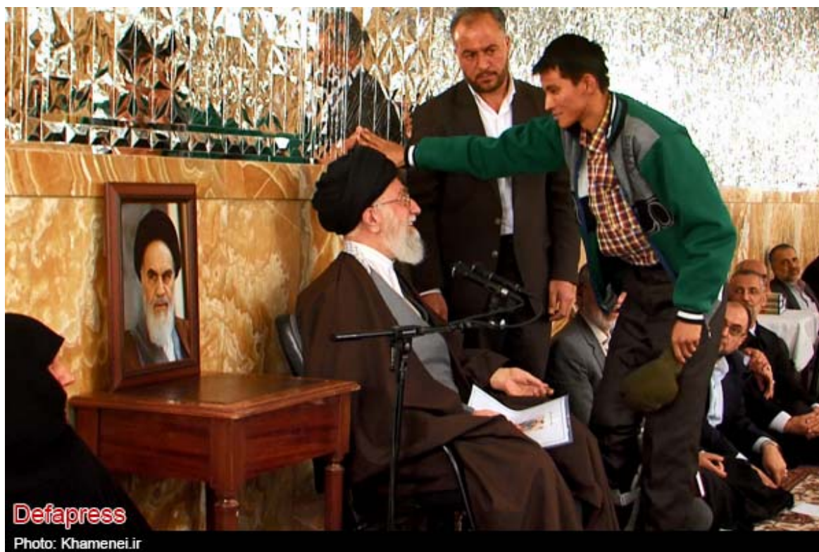
Defapress Photo: Khamenei.ir

تهیه و تدوین: دکتر محمدرضا طلایی، عضو هیئت علمی دانشکده راه آهن (برگرفته از سایت خبرگزاری دفاع مقدس)