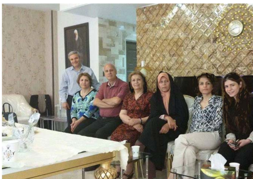
جدیدترین هزینه‌تراشی خانواده هاشمی برای نظام: دیدار با افتخار فرزند خانواده هاشمی با بهائیان